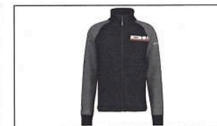
Sweatshirt REVS pour homme B19-AJ103-B1-XX