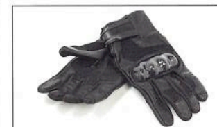
Gants pour homme A21-BG102-B0-XX