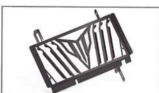
MT-125 Protection de radiateur B7D-F1557-MA-ST