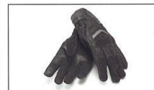
Gants d'été pour homme A20-BG112-B0-XX