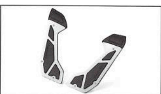
NMAX 125 Platine de marche-pieds B6H-F74M0-00-00