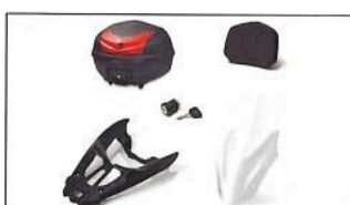
NMAX 125 Urban Pack B6H-FVUP0-00-00