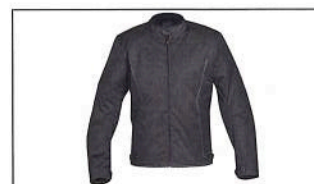
Veste urbaine pour homme A21-BJ101-B0-XX