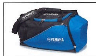
Sac de sport Yamaha Racing T18-LC009-E1-00