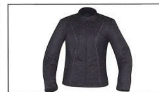
Veste urbaine pour femme A21-BJ203-B0-XX