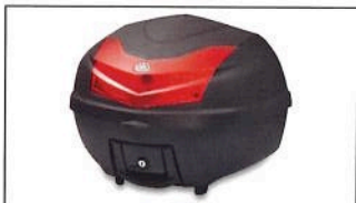
D'elight Topcase City 39L 52S-F84A8-00-00