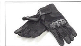
Gants pour femme A21-BG201-B0-XX