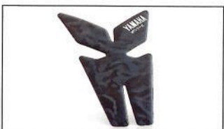
MT-125 Autocollants de réservoir B6G-FTPAD-00-00