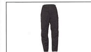
Pantalon Sport-Touring pour homme A20-BP102-B0-XX

Les photos ci-dessus montrent une sélection de vêtements de loisirs de Yamaha. Ton partenaire officiel Yamaha peut te donner un aperçu complet des vêtements disponibles que tu trouves également sur notre site www.yamaha-motor.ch .