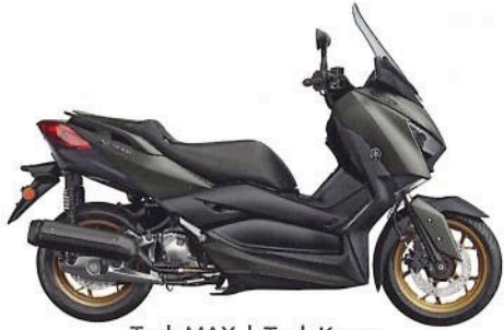
Tech MAX | Tech Kamo