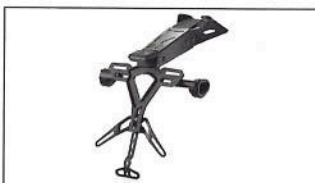
R125 Support de plaque B5G-F16E0-10-00