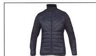
Veste de loisir «Nothing but the MAX» B21-UR204-B0-XX