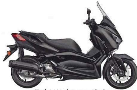
Tech MAX | Power Black