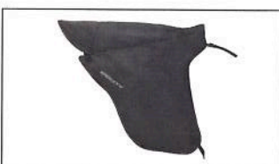
Tricity 125 Protection contre le vent et les intempéries 2CM-F47L0-00-00