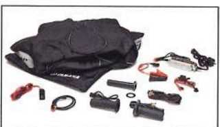
XMAX 125 Winter Pack B74-FAS00-00-00